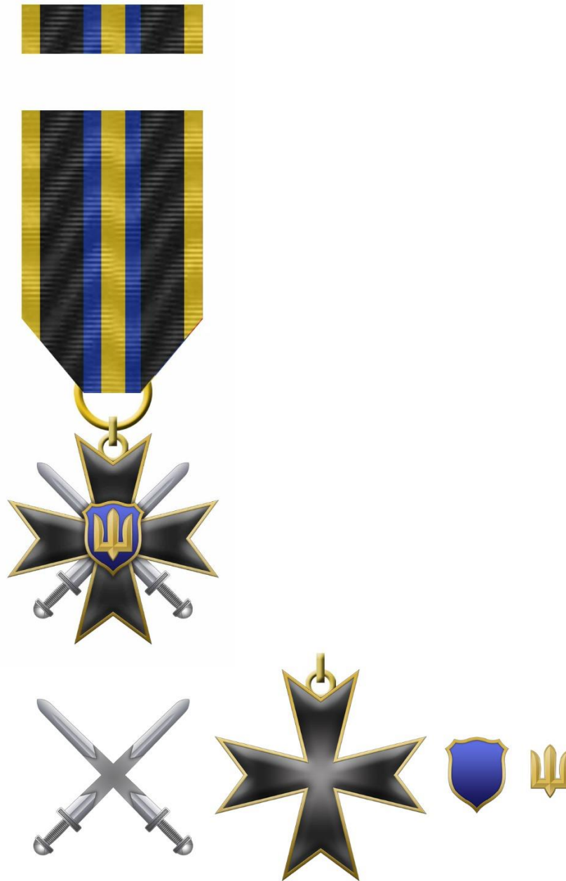
Рисунок 1 – Зовнішній вигляд предмета