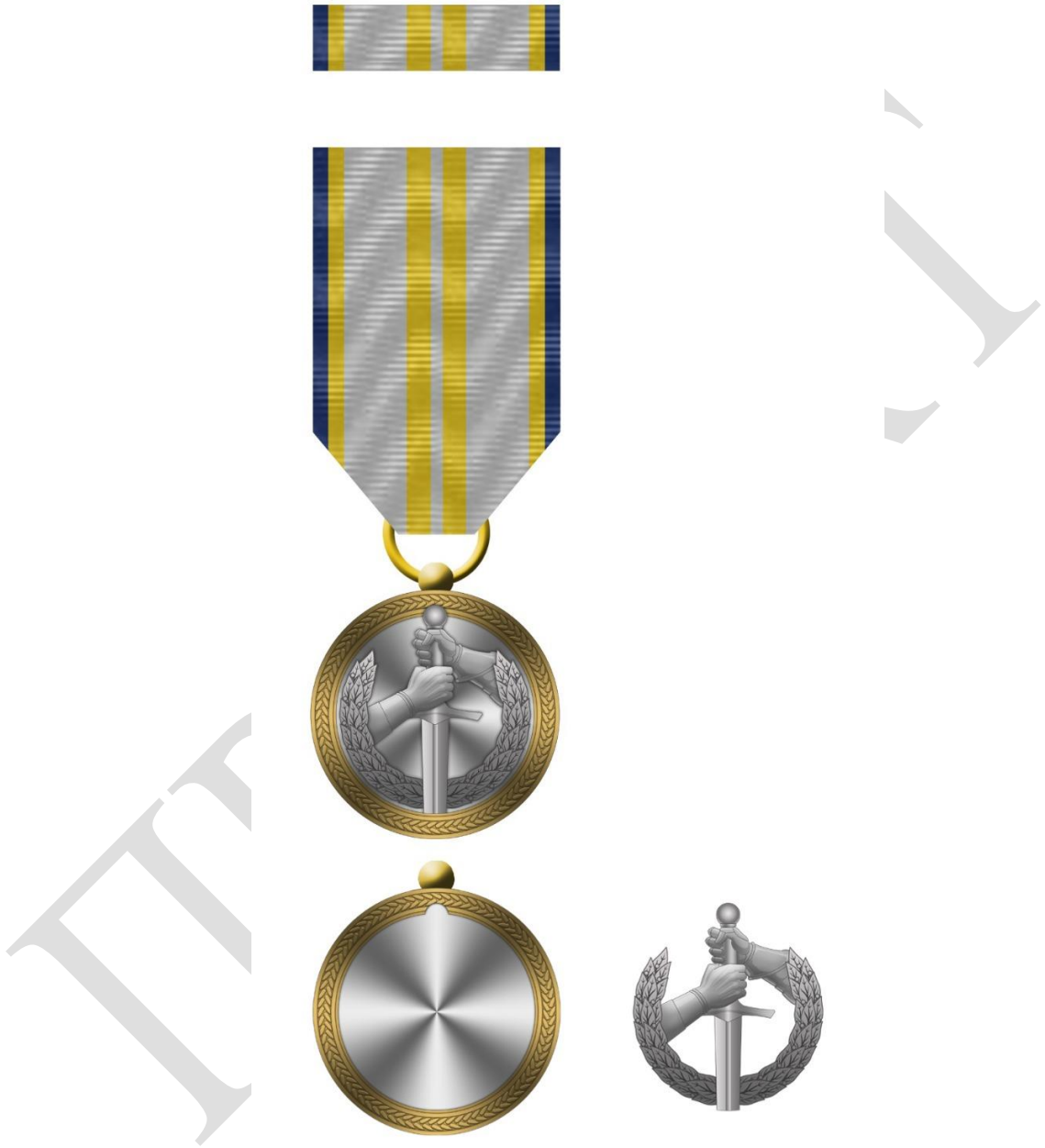
Рисунок 2 – Зовнішній вигляд предмета