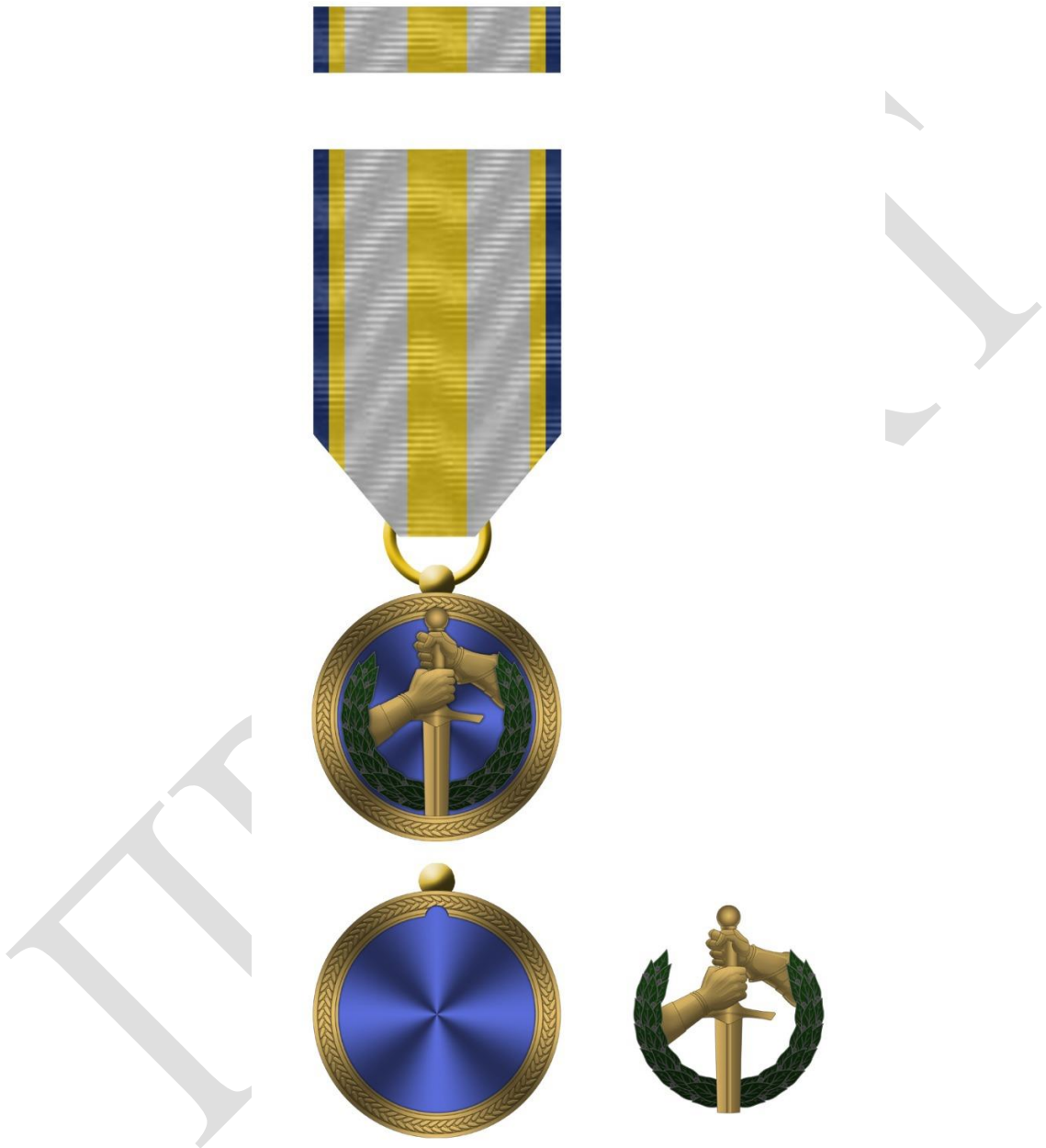
Рисунок 1 – Зовнішній вигляд предмета