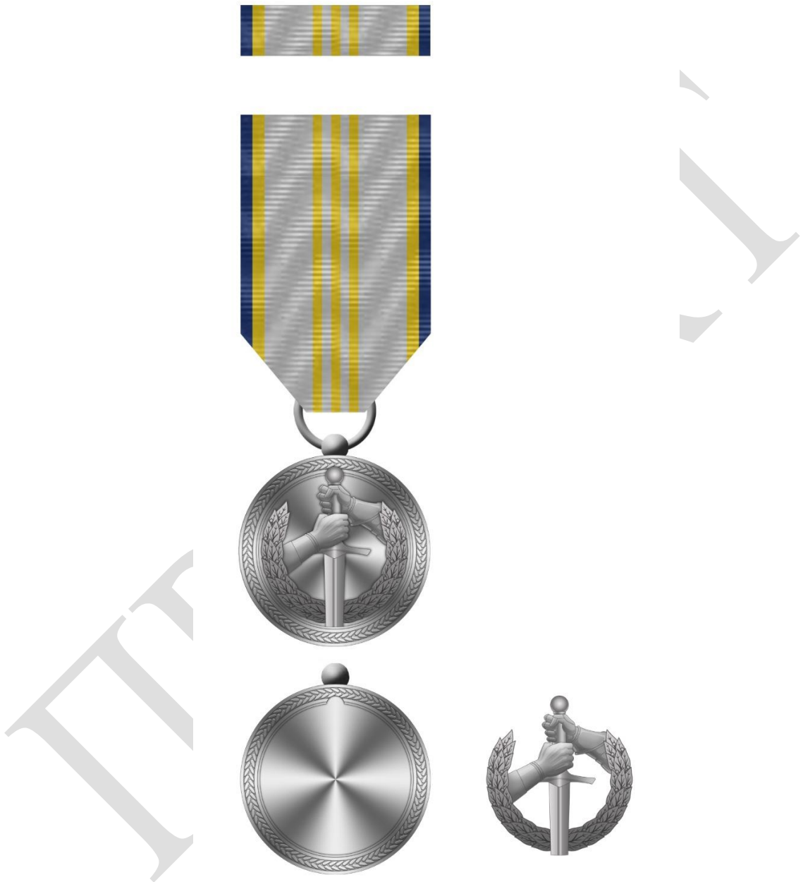
Рисунок 3 – Зовнішній вигляд предмета