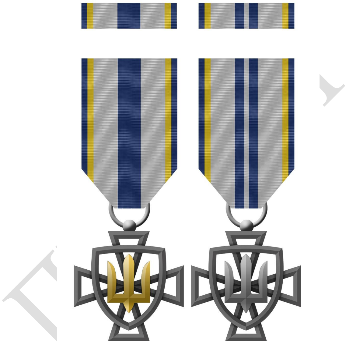
Рисунок 1 – Зовнішній вигляд предмета